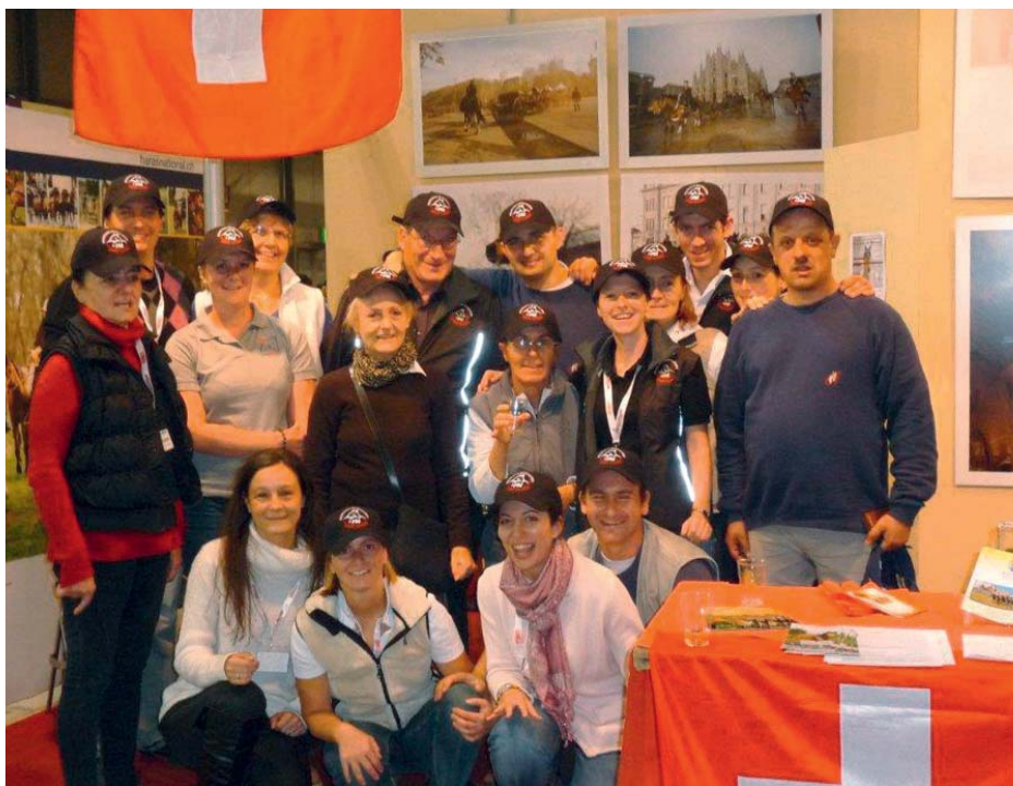
Les participants à la Foire de Milan, Italiens et Suisses, tous réunis pour la photo de famille. Gruppenfoto mit allen Teilnehmern der Mailänder Messe, Italienern und Schweizer.