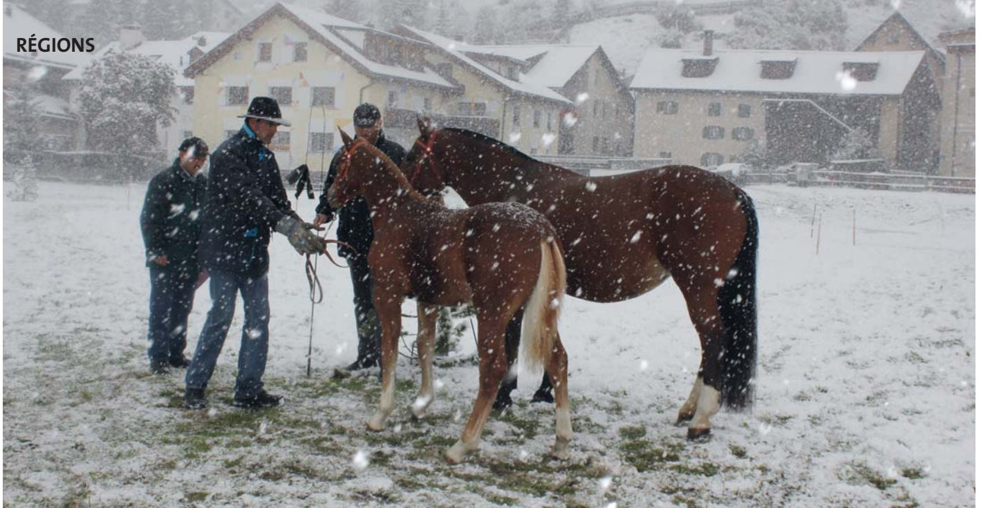
A Zernez, l'arrivée de l'hiver ne passait pas inaperçue In Zernez, war der Wintereinbruch nicht zu übersehen