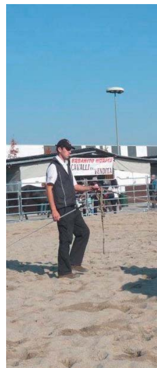
A Milan, les chevaux franchises-montagnes se sont prêtés à des démonstrations de voltige. Die Freiburger Pferde wurden in Mailand für eine Voltigier-Demonstration eingesetzt.